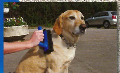
für Hunde und Katzen