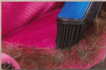
entfernt Tierhaare überall