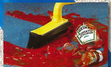
praktisch im Haushalt