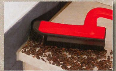
sauber bis in die Ecken