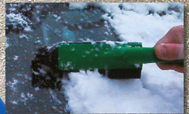
fegt Schnee vom Auto