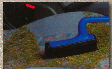
super auch im Auto